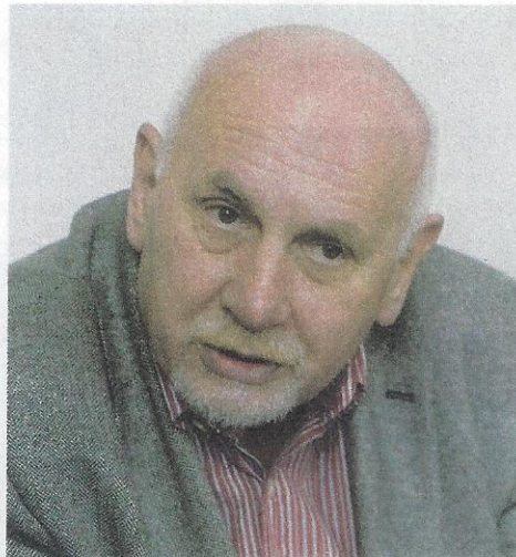
PAVEL RYCHETSKÝ (67)

Za sebe mohu říci, že na počátku byl můj názor přesně opačný než mé konečné hlasování. Přesvědčila mě až debata s jedním expertem, který léta pracoval na ministerstvu práce a sociálních věcí a nyní je na Nejvyšším správním soudu a celý život byl odborníkem přes legislativu a aplikaci v této oblasti. A ten mi přiznal, že na ministerstvu práce léta věděli, že důchodový systém je neudržitelný a že se rozevírají jeho nůžky. Prostě to, do jaké se ten systém dostal situace, odborníci vnímají už dlouhou dobu. Mimochodem v České republice jsou celé tři miliony důchodců, z nichž asi jen pět tisíc je postiženo extrémním nepoměrem důchodového systému, takže finanční dopad rozhodnutí ÚS je naprosto zanedbatelný.