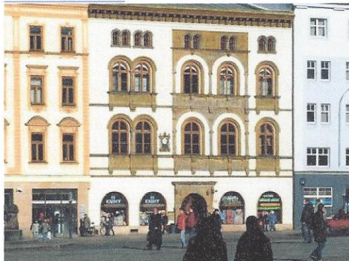
Edelmannaov palác na Horním náměstí v Olomouci